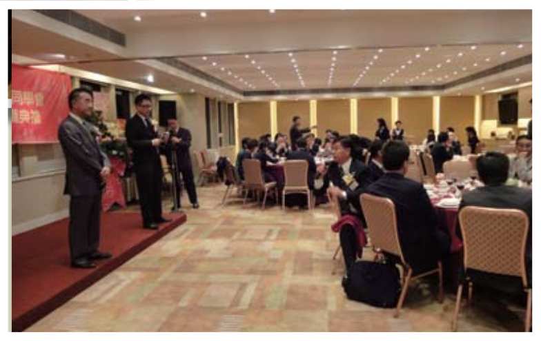
當日邀請到田北辰議員作嘉賓。