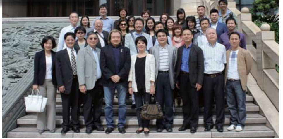
澳門之旅吸引到一眾同學參與，舉辦得非常成功！