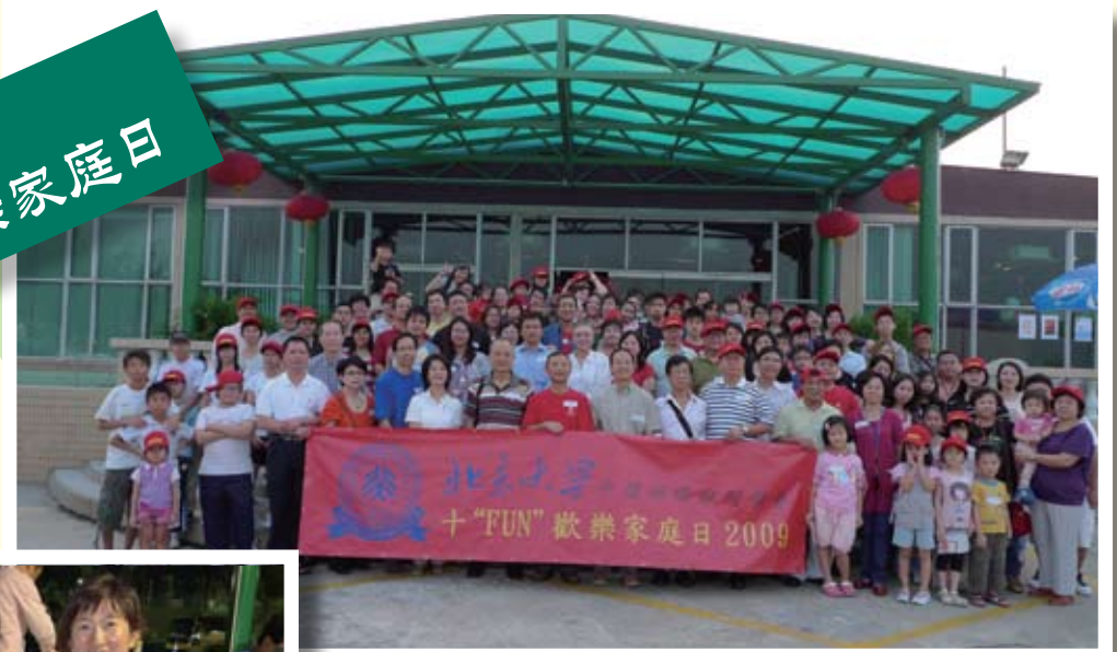
2009年的家庭日活動得到同學們的大力支持，人才濟濟！