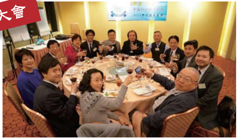
每年一次的周年大會除了報告會務外，亦可與同學們聚首一堂，樂也融融。