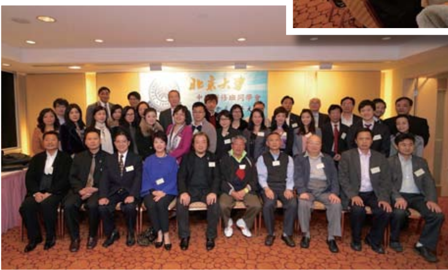
每年同學們都會抽空出席了解本會過往及未來發展同時提出意見令本會更為完美。