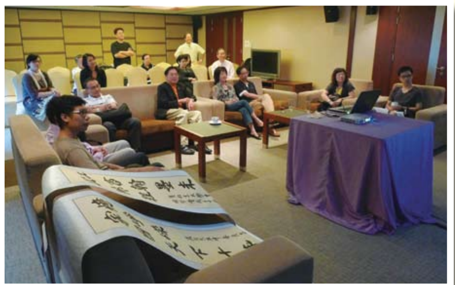
觀看活動短片及圖片秀。