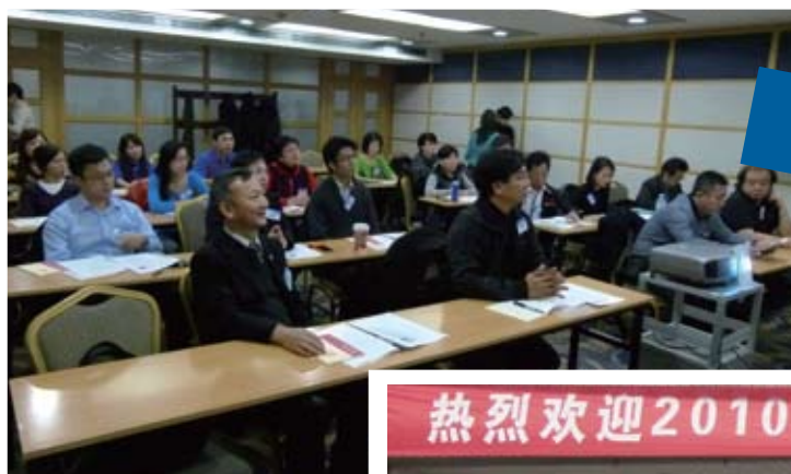
各同學都非常專心地聽教授的講解。