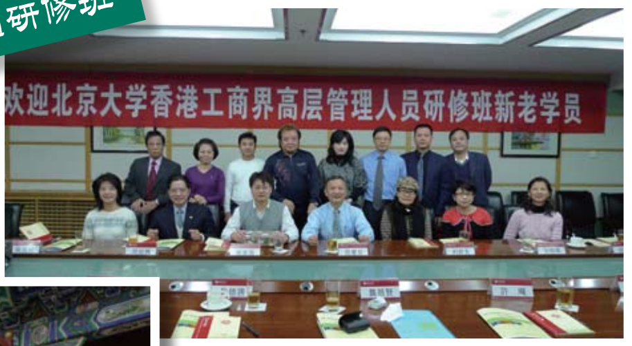
2009年研修班新舊同學合照。