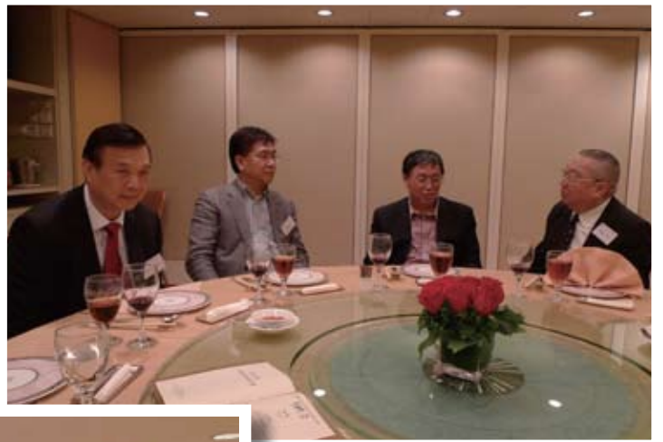
同學會邀請胡景岩司長晚宴，席間胡景岩司長向出席同學，解說當前經濟形勢。