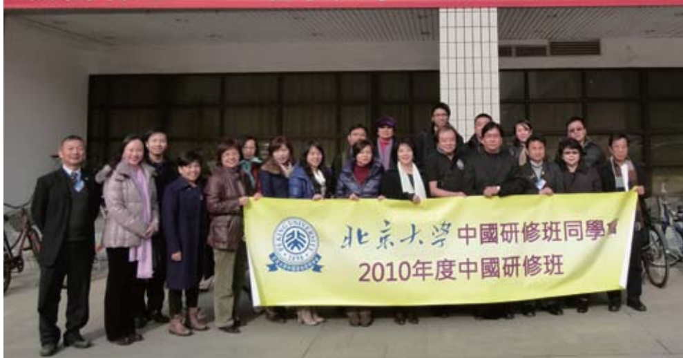
2010年出席研修班的新舊同學們一起大合照。