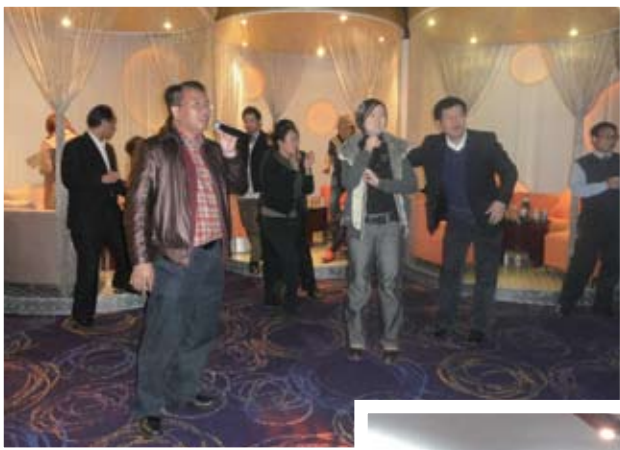
勤奮學習後，同學們到卡拉OK聯誼。