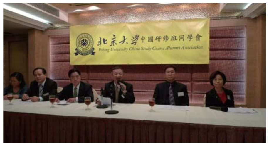
會長及理事們正在報告我會一切會務 及過往所舉辦的活動。