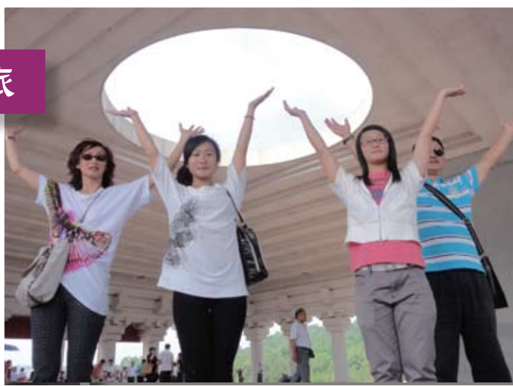
同學們對皇帝陵的“天圓地方”非常感興趣。