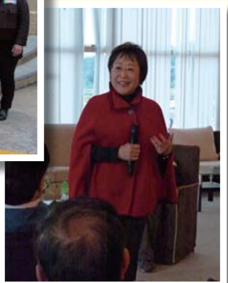
此年更榮幸邀請到了劉健儀議員到場演講。