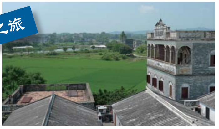
綠草與舊式大樓配合成一幅風光如畫般的照片。