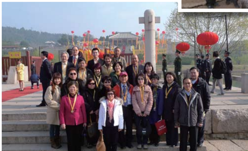
出席祭黃帝陵慶典。