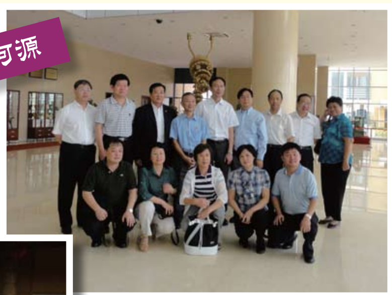
同學們與副校長合照。