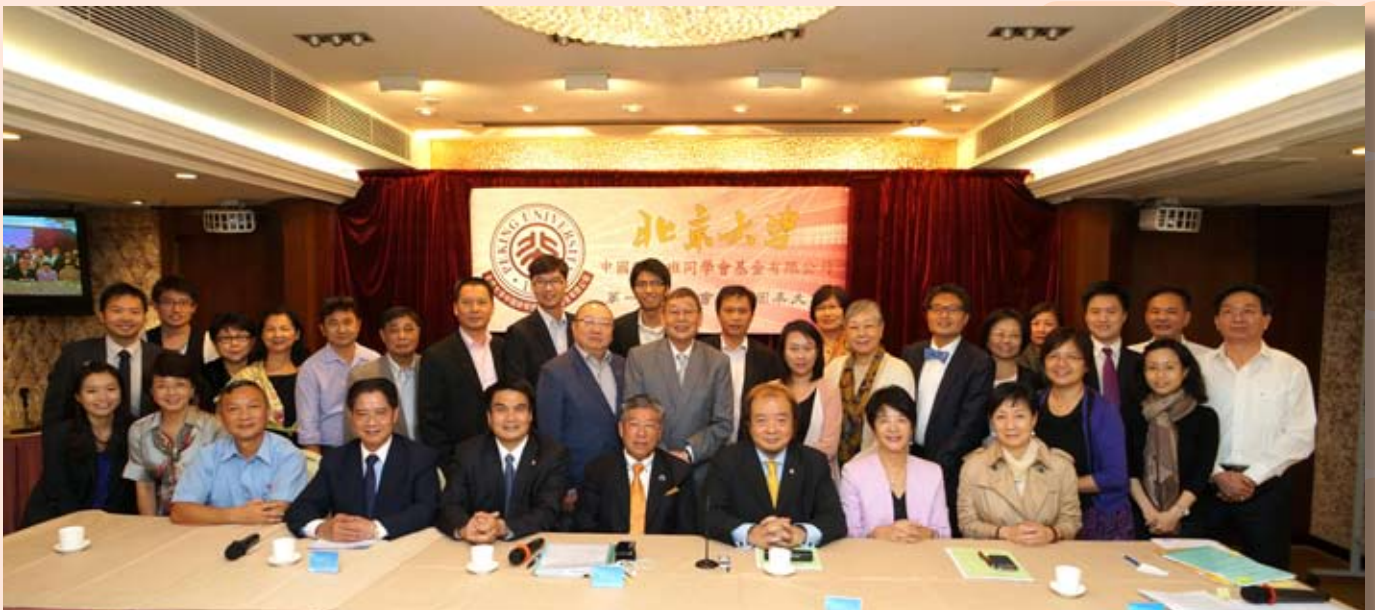
多位新舊同學鼎力支持並見證基金會成立的歷史一刻