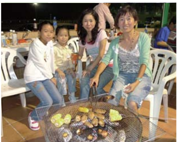
大家在燒烤各式各樣的食物，非常滿足！