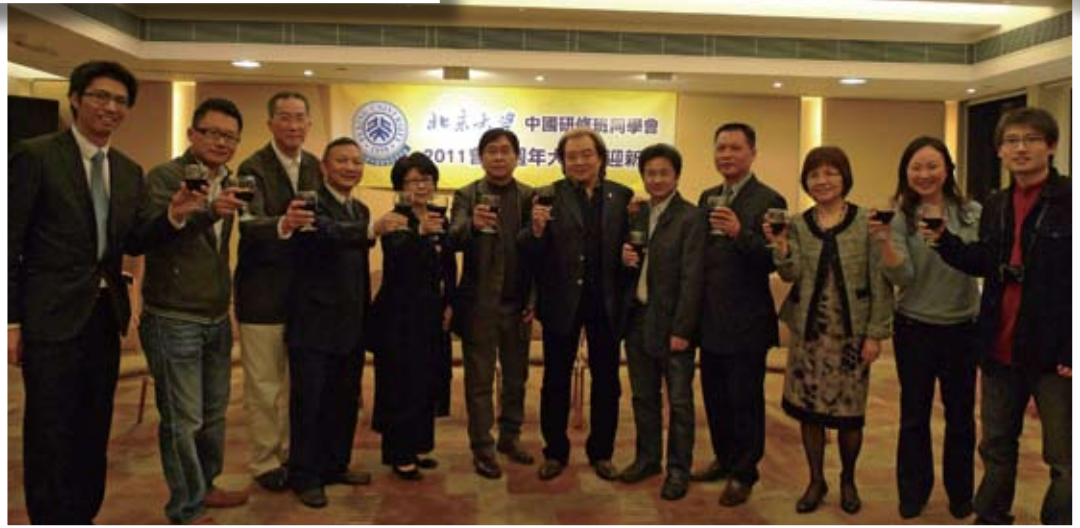
理事會及各工作人員一起祝酒。