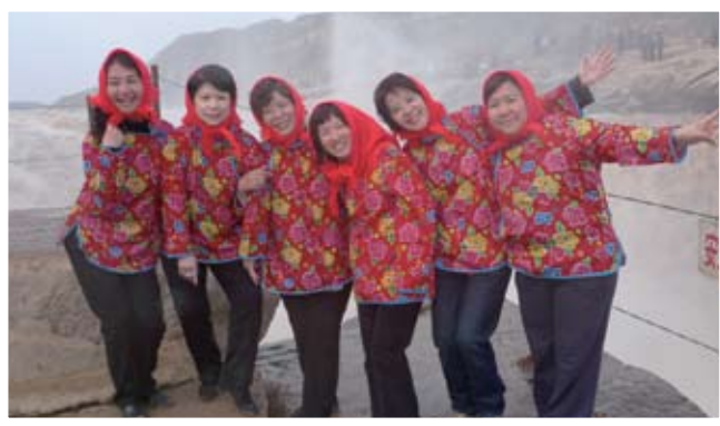
陝西省壺口瀑布前的一群村姑娘。