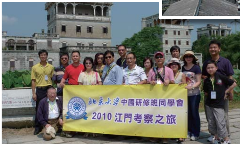
江門考察之旅一行人合照。