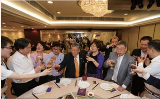
選舉過後大家歡聚暢飲