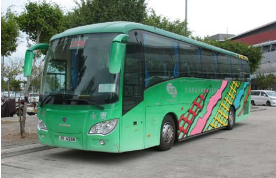
先鋒一型 (47座位豪華型)