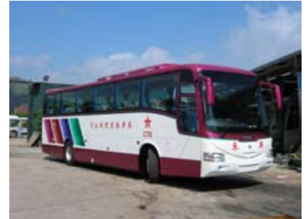
中港綫過境豪華巴士