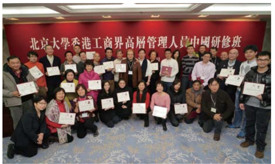
勤力的同學們拿著證書一起畢業。