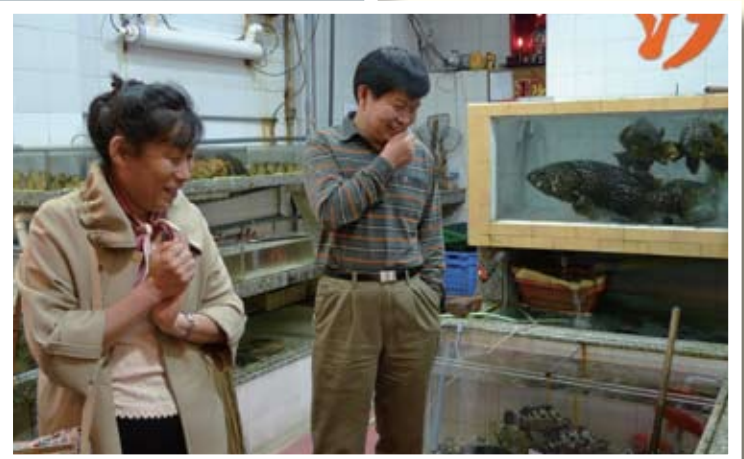
揀選海鮮作晚餐食材。