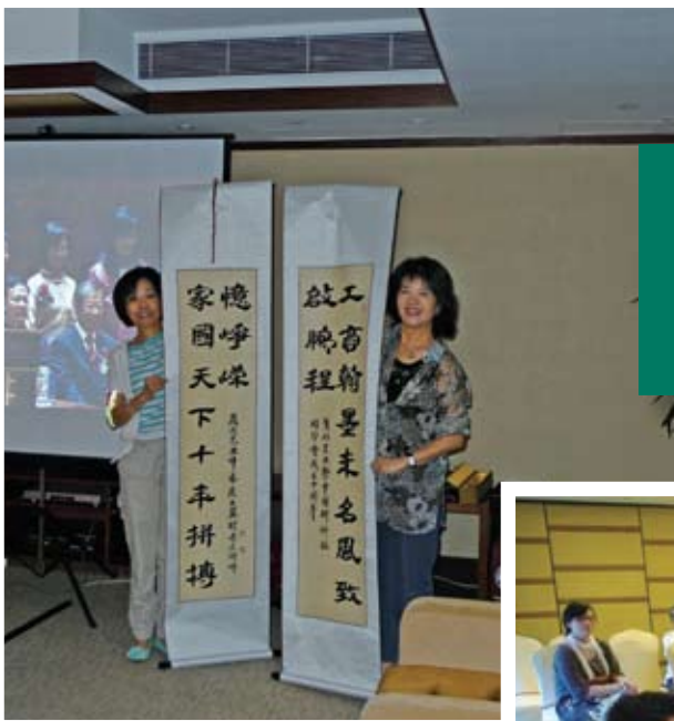
展示北大送贈同學會的對聯。