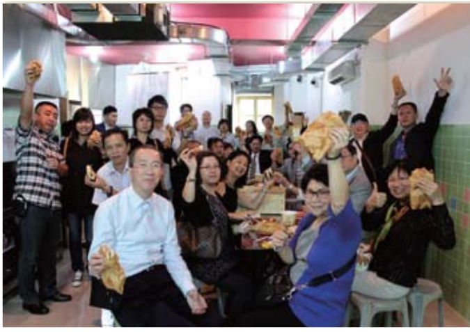
大家都在試食澳門出名的食物，非常美味！