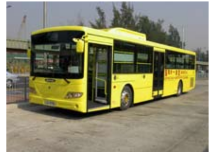
落馬洲專線公營巴士