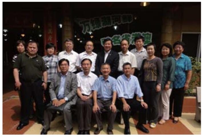
菊傳進副校長到訪河源，對同學的業務情況十分關懷。