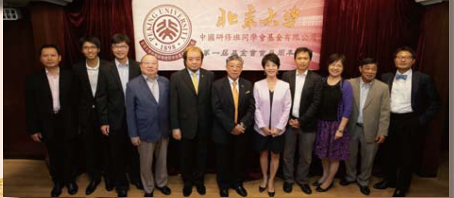
第一屆基金會董事會大合照