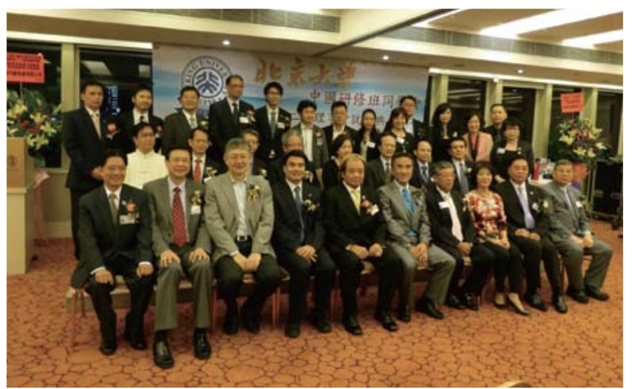
當晚有幸能邀請到田北辰及施永青兩位名人到場。