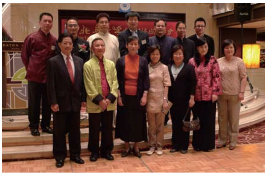
北大的貴賓們亦有被我會邀請到港參加如此盛大的慶典!