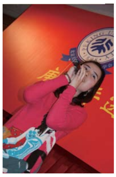
歌唱表演把氣氛推至高峰！