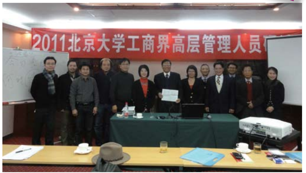
本會上課後致送紀念品給教授以表心意。