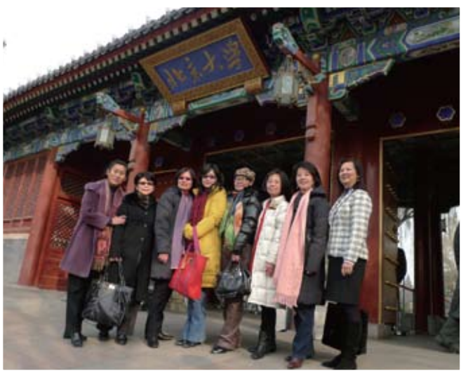
身在北大當然要於正門拍照留念!