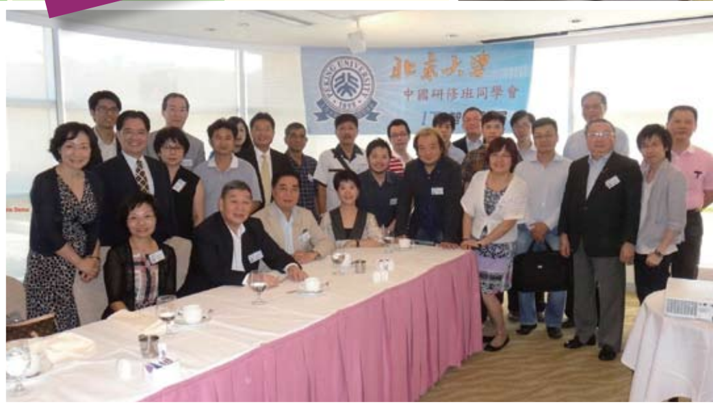
由於智能手機幾乎已經成為生活必需品所以眾多同學都參與智能飯局了解其中的秘密。