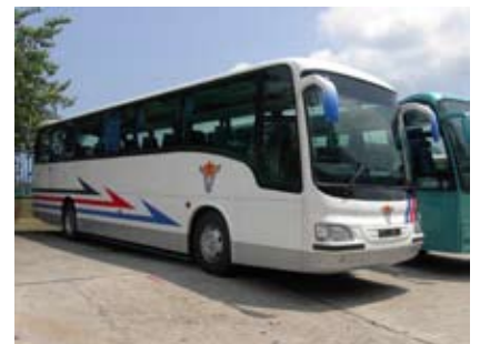
解放軍駐港部隊使用