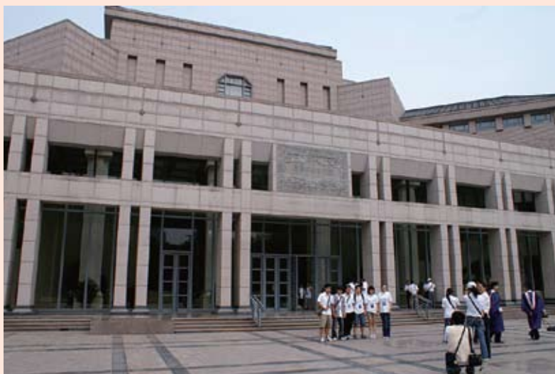
1999年本會於北大百年校慶捐款港幣五萬三千七百元建做百週年紀念堂座椅